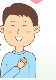
息子(保険契約者代理人)